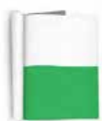
1/2 PÁGINA 21cm x 14cm