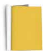
PÁGINA INTEIRA 21cm x 28cm