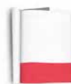
1/4 PÁGINA 21cm x 7cm