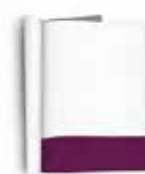
1/6 PÁGINA 21cm x 4,5cm