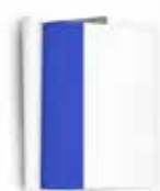
1/3 VERTICAL 7cm x 28cm