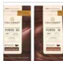
CALLEBAUT@ LANÇA ...