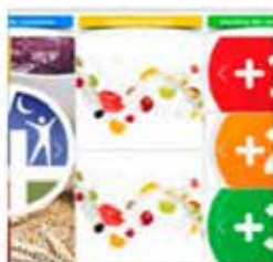
GEMACOM TECH LANÇ...