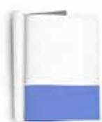
1/3 HORIZONTAL 21cm x 9cm